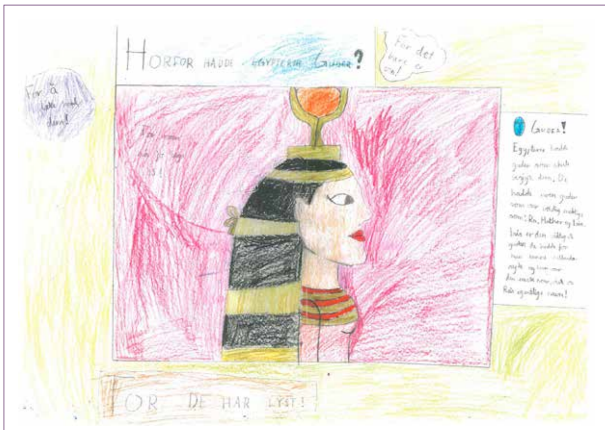
Figur 5: Oppslag fra Gros bok om “Det gamle Egypt”:

“Elevene viser noen tegn på at de forstår seg selv som naturvitere og fagbokforfattere. Disse tegnene viser seg i tekstene de skriver (writing), men også i deres viten om tekster (knowing) og måten de opptrer på (doing)