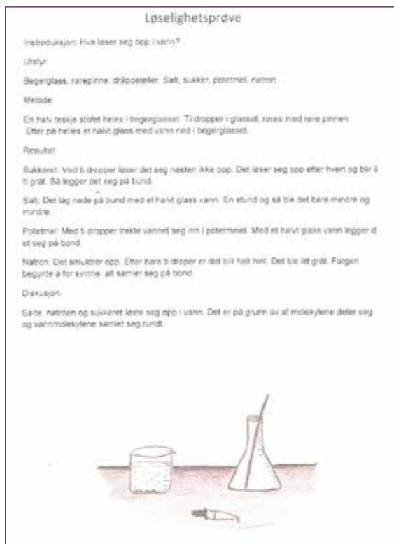
Figur 2: Gro & Tines labrapport

Også Gro & Tine har skrevet en labrapport med mange fagrelevante sjangerkonvensjoner: IMRaD-strukturen er tydelig, metod delen inneholder passivkonstruksjoner og i diskusjonen har de brukt faguttrykk som «vannmolekyler». Slik posisjonerer de seg som naturvitere både gjennom kommunikasjonsform og