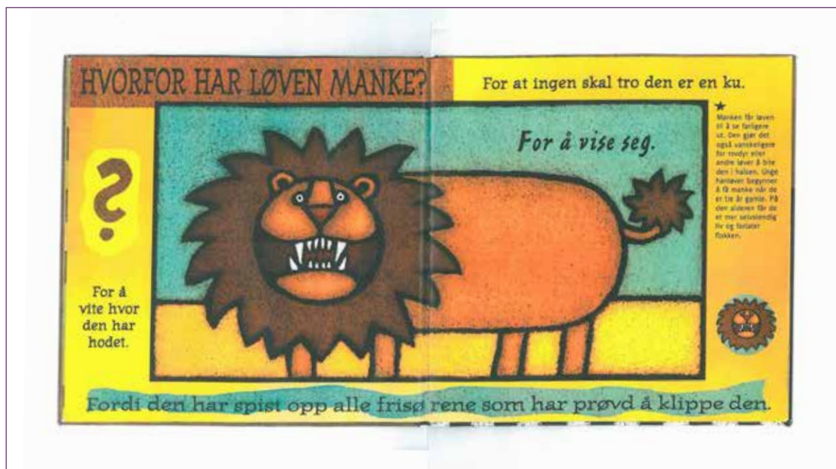
Figur 3: Løveoppslaget, Lila Prapp (2004)

Oppsummert kan en si at Vegard & Morten og Gro & Tine posisjonerer seg som naturvitere i labrapporten ved å bruke en kommunikasjonsform som er gjenkjennelig (IMRaD), innslag av naturvitenskapelig språk (passiv, nominalisering, ikke bruk av personlige pronomen) og de simulerer en tenke- og væremåte som naturvitere (intervju + vernebriller).