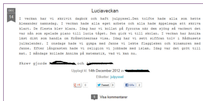
Bild 2. En klassblogg från årskurs 2.

I bild 2 finns ett autentiskt inlägg från en klassblogg från (den svenska grundskolans) årskurs 2. Eleverna får turas om att skriva inlägg. Materialiteten finns på riktigt, dvs. de sätter sig parvis vid datorn för att rapportera om vad som hänt i klassen, i det aktuella fallet Luciaveckan. Fröken stöttar om så behövs och är den som publicerar det färdiga inlägget.