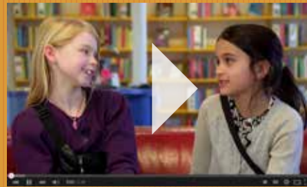
Liva og Lola giver fif.