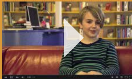
Joshva giver fif.