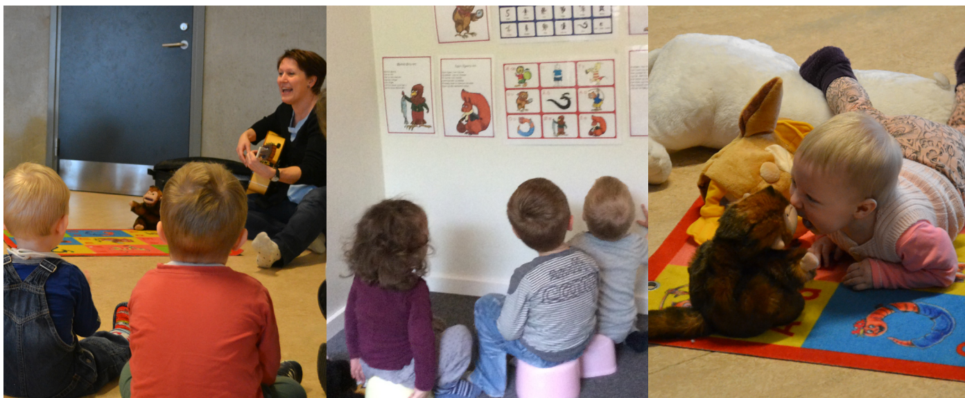
Dagplejebørn leger med lyde