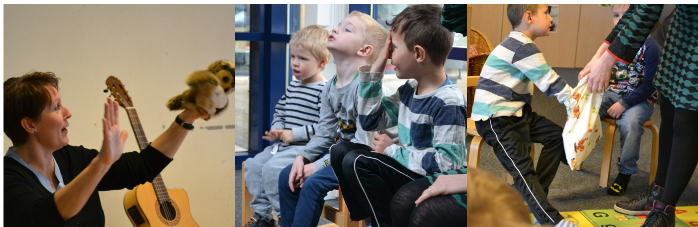
Vi leger med lyd og ordforråd

Alle disse forslag til tiltag baserer sig på, at udvikling og læring bør være tæt knyttet til hverdagens professionelle praksis. Det sikrer erfaringsmæssigt bedst forankring. Hovedpointen og hovedformålet skulle være at få alle professionelle voksne, der er ansvarlige for børns pædagogiske og faglige udvikling fra 0–18 år, til at udvikle en fælles indsigt og pædagogisk tilgang til barnets sproglige vej fra lille til stor.