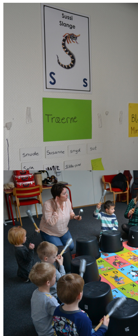
Lyd og rytme

Line laver en ny øvelse, hvor de skal stille sig på række, alt efter om de er højest eller lavest, og det volder større vanskeligheder, for alle vil gerne være højest. Det fører så også til en snak om forskellene på færrest bogstaver og mindst i højde.