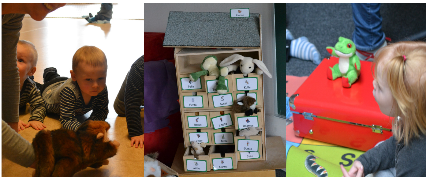
Sprog er lyd og leg

Grafem-alfabetet er det skrevne alfabet. Det findes som udskårne bogstaver, som den enkelte institution kan anskaffe. Ved at lave aktiviteter, hvor børnene kan mærke bogstaverne, kan man arbejde med børnenes kinæstetiske sans, og børnene kan se og mærke bogstaverne.