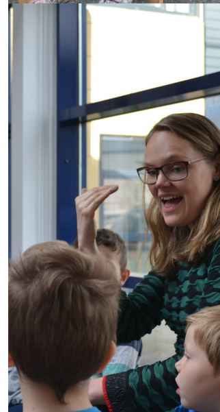
Lære med lyd, rytme og håndfonemer