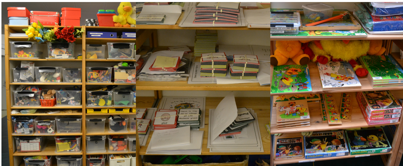
Materialer til udlån i Sproghuset

Legeteket låner materialer ud til forældre, fagpersoner og institutioner i Viborg Kommune. Det kan sammenlignes med et velassorteret bibliotek med legetøj og stimulus-genstande på hylderne, ligesom der står bøger og spil, og personalet giver gode råd til brugerne.