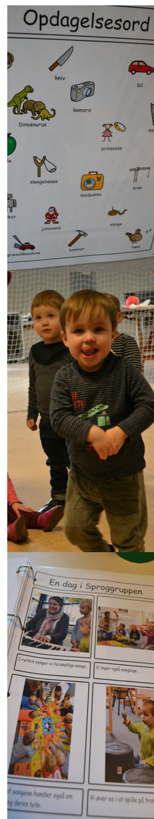
Sprog i brug i dagpleje og sproggrupper

Viborg Kommune ville med et sådan tværfprofessionelt projekt gå foran med et eksempel på en helhedsorienteret indsats fra dagpleje, dagtilbud og skole om sproglig udvikling. Det vil være en indsats, som mange efterspørger, men som få praktiserer.