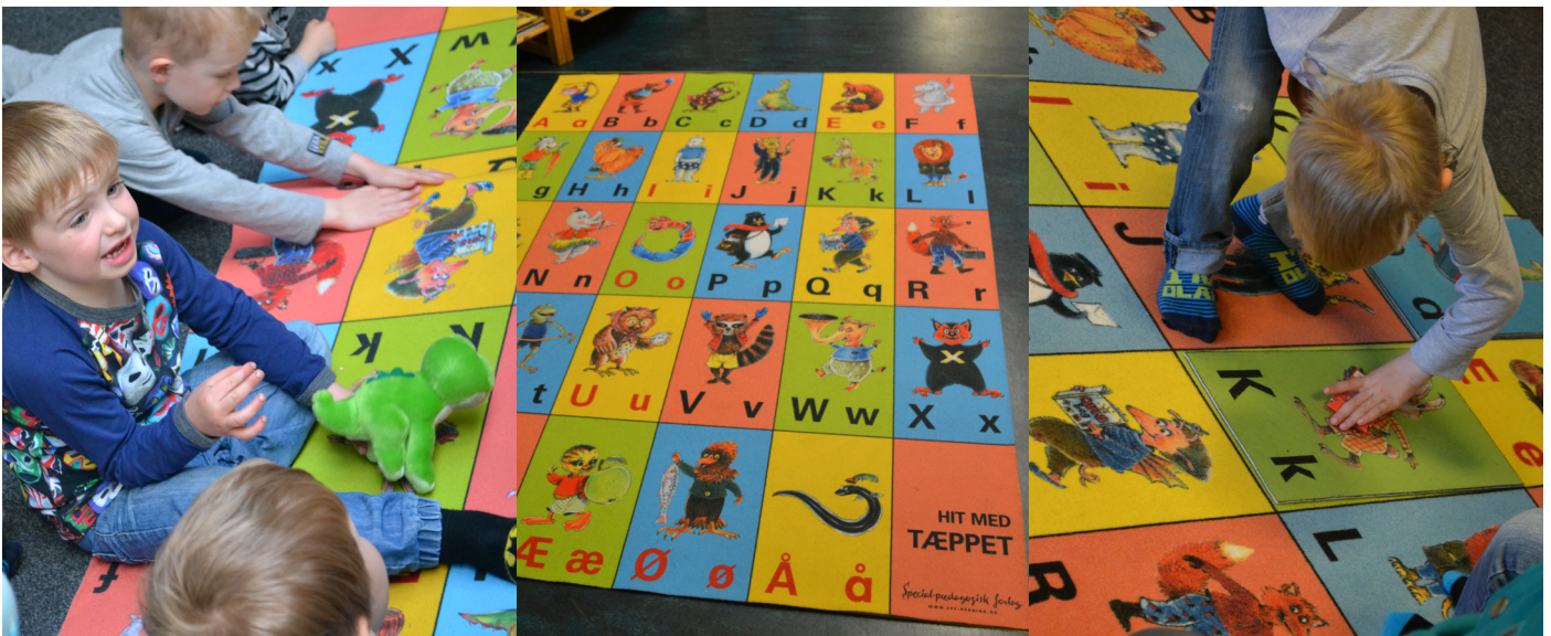
Tæpper med alfabet og dyr

Vejledningen giver en række anvisninger til, hvordan pædagogen kan arbejde med børnenes produktive og receptive sprog og lydlige kompetencer ved henholdsvis at samtale om begreber, farver, tal og dyr og lave forskellige legeaktiviteter, der skal fremme børnenes lydlige forståelse af bogstaverne.