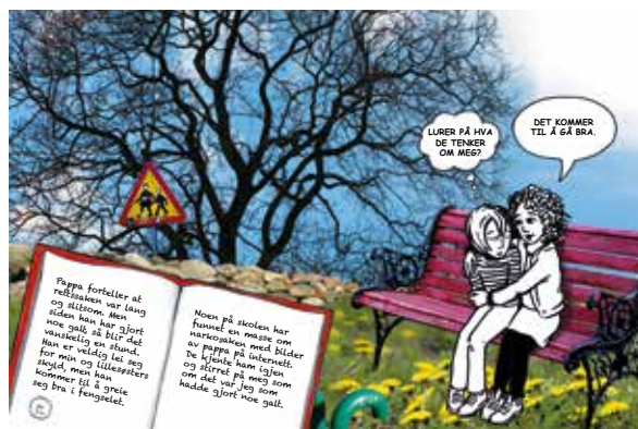
Oppslag fra fagboken På utsiden (Omsén og Wik 2014)

I et oppslag fra På utsiden ser vi de håndskrevne dagboksnotatene til hovedpersonen Thea i forgrunnen. Håndskrifta og den personlige tonen i teksten viser at dette er Theas oppfatning av det som skjer. Samtidig trekker hun inn det faren har fortalt henne om rettsaken og at han er lei seg på grunn av barna. På bildet ser vi Thea og moren hennes som sitter på en benk. Moren trøster og Thea tenker på hva vennene hennes tenker om henne. Selv om opplevelsene formidles gjennom Thea kommer det likevel tydelig fram at en slik situasjon kan oppleves forskjellig avhengig av om det er Thea, faren, moren eller vennene som opplever.