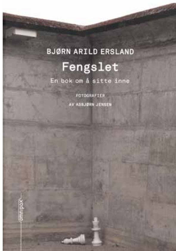
Fagboken Fengslet (Erslund og Jensen 2010)

Dette viser at det ligger et fortolkningsarbeid forut for det vi kan lese i boken. Forfatteren har satt sammen og fortolket opplevelsene til flere virkelige barn. På dette grunnlaget har hun konstruert et typisk barn som det er mulig for flere barn å kjenne seg igjen i. Den samfunnsvitenskapelige metoden er utgangspunktet, men den er delvis skjult for barneleseren.