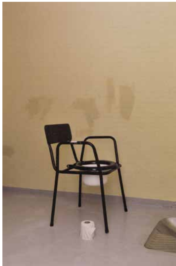
Illustrasjon fra fagboken Fengslet (Ersland 2010, s. 16).

til uttrykk gjennom svarte typer, mens dagboksnotatene er blå og faktatekst om rettssystem og fengselsvesen er trykt med røde fonter. Dette er en tydelig tilpasning til en ung og uerfaren leser av samfunnsvitenskapelige tekster.