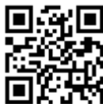
QR 1: Kompetencecenter for Læsning, Thisted Kommune