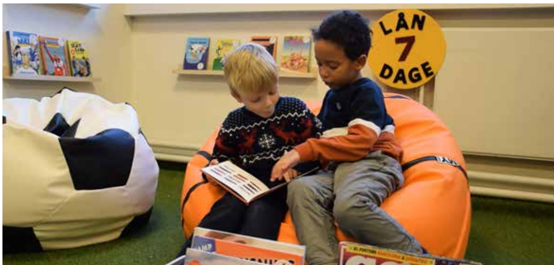
Foto 5: Børn der læser i Satellittens sportshjørne.

er, som er nemme at afkode for børnene. Der er blandt andet et fodertrug til hestebøger, toiletter til de sjove bøger, en kuffert til bøgerne om at gå på opdagelse og en heksegryde til de uhyggelige. I midten af det hele er der en stor luftballonskurv, hvor børnene kan finde sammen i uformelle læsefællesskaber. En lærer fra skolen fortalte om, hvordan en af hendes elever syntes meget bedre om Satellitten end skolebiblioteket, fordi her følte han sig ikke dum. På skolebiblioteket kunne han have svært ved at finde frem til de bøger, som han syntes om. Men i Satellitten kunne han nemt afkode, at de bøger, han kunne lide, nok befandt sig i det græsbeklædte sportshjørne. Det har selvfølgelig noget at gøre med størrelsen, men jeg tror også, at det rammer ind i Alfreds begejstring. Satellitten taler til børnene i et sprog, som de nemt forstår og føler sig trygge i.