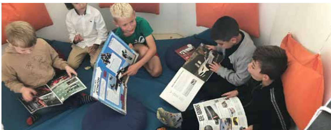
Foto 1: Børn der læser om maskiner i Satellittens luftballonkurv.