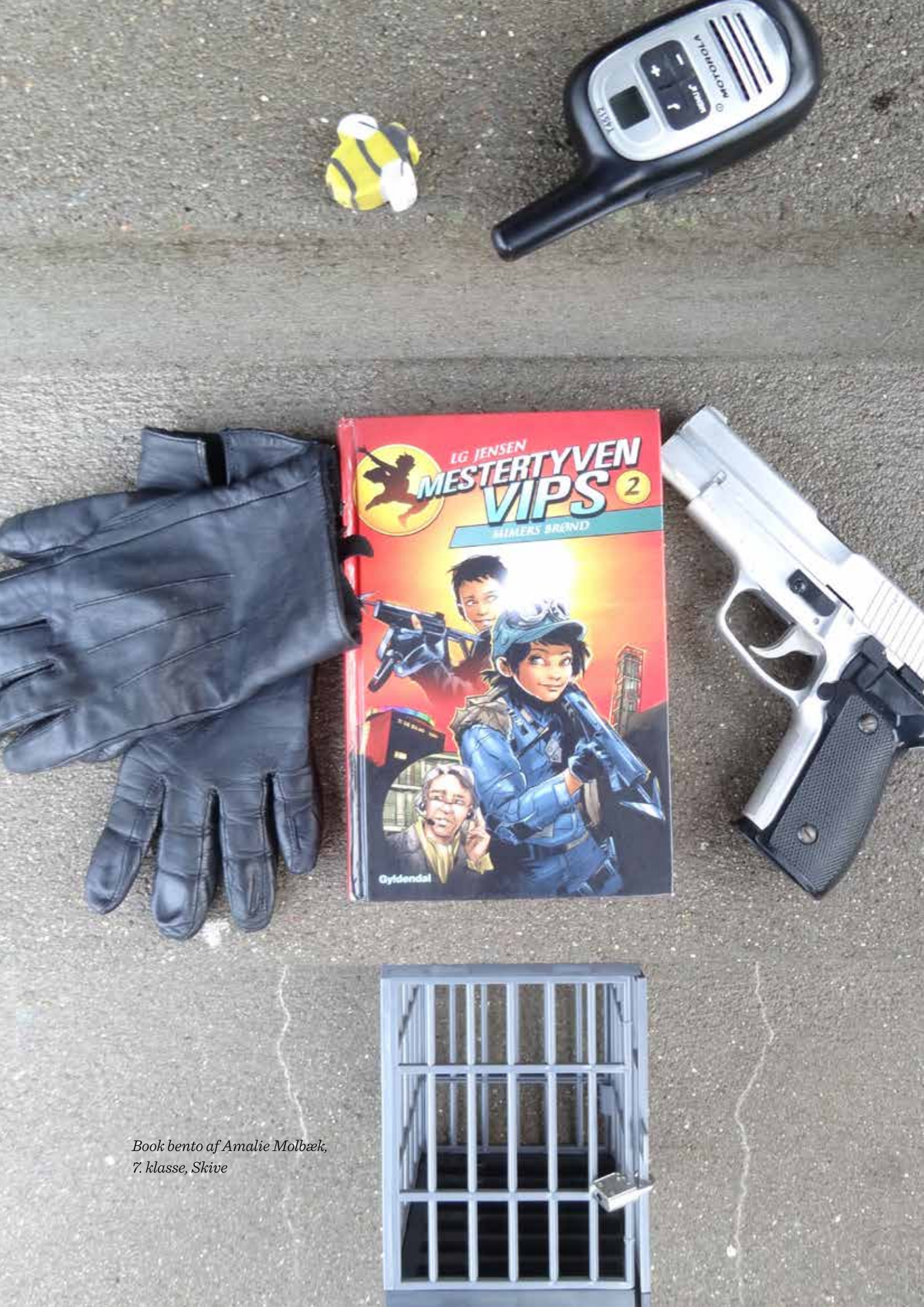
Book bento af Amalie Molbæk, 7. klasse, Skive