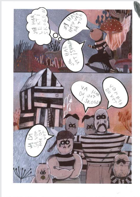
Bilde 7: Elevarbeide

Pølsetjuven Kjell: «Jeg har lekt i skogen», «Jeg har bare vært på tur», «Jeg har vært i skogen»