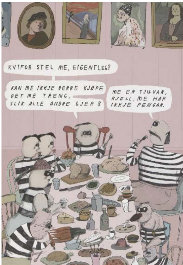
Billede 9: Hvilke malerier har familien Tjuv på vegg?

Ved å studere og sammenlikne begge innsidepermene kunne elevene altså oppdage sammenhengen mellom dem. Eller kanskje kjenner elevene igjen kjente malerier hos familien Tjuv. Hvordan har de fått tak i disse, mon tro?