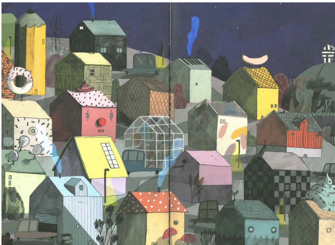
Billede 2: Innsidepermen foran i boken.

Læreren viste så innsidepermen av boken og ba elevene studere bildet av byen for å finne ut hvor Kjell bodde: