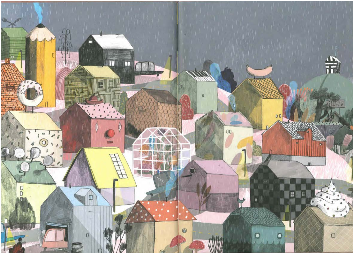
Billede 8: Innsidepermen bakerst i boken.