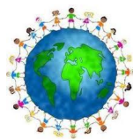
Billede 10: Oppgave om Pølsetjuven og barns rettigheter.

SKRIV RETTIGHETEN DU MENER PASSER BEST OG SKRIV HVORFOR DU MENER DET.