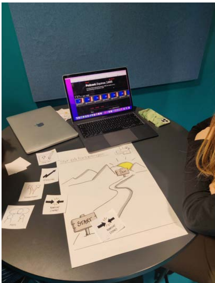
Billede 4: Tidslinje på Padlet, Styr på fortællingen .

begivenheder, der er i lydfortællingen. Den kan give overblik over kronologien i lydfortællingen, om der er spring i tid, flashbacks eller flashforwards. Benytter man tidslinjen i det digitale redskab Padlet, kan man bruge både billeder, lyd og skrive tekst.