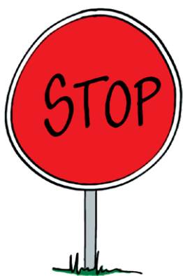
Billede 3: Stopskilt.

Inden klassen går i gang med at lytte, skal eleverne også blive opmærksomme på, at det kræver en aktiv handling, hvis de mister koncentrationen under lytningen. Ligesom man under læsning kan komme til at tænke på andre ting, så man må tilbage og genlæse noget af teksten, så kan man som lytter også få brug for at spole tilbage, hvis man misser noget. Eleverne kan som hjælp opøve en evne til at se et stopskilt for deres indre blik, når deres tanker forsvinder i andre retninger. Det skal de gøre under lytning , men de skal gøres opmærksomme på det og øve sig i det inden den selvstændige lytning. For eksempel kan man gøre det sammen ved at lytte til en lille bid af en lydfortælling og tænke højt, når tankerne flyver væk, eller man mister koncentrationen, og så markere med stopskiltet (se billede 3).