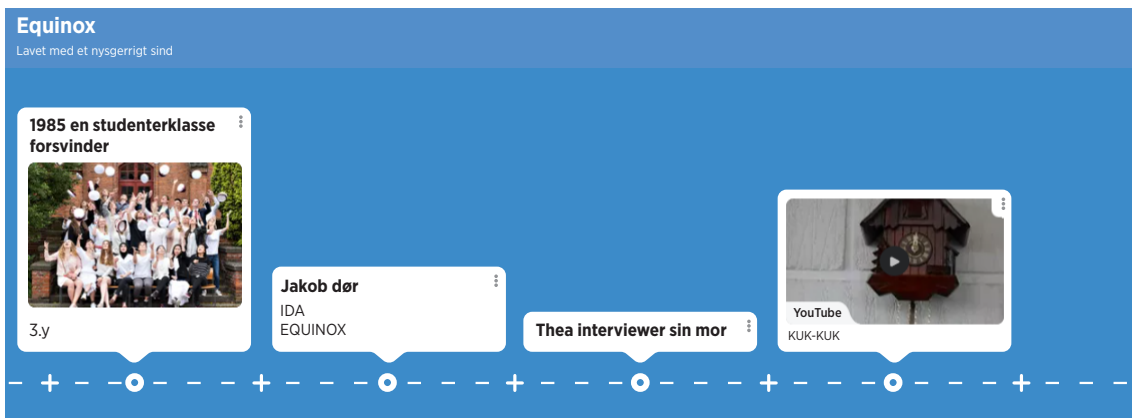
Billede 5: Styr på handlingen.

Disse strategier kan benyttes til at skærpe elevernes fokus på kompositionen og som en strategi til at visualisere de indre billeder, de danner under lytning, da de har en konkret visuel opgave, mens de lytter. Brug af artefakter hjælper eleverne til visuelt at holde styr på fortællingens elementer og til at fastholde dem under lytning.