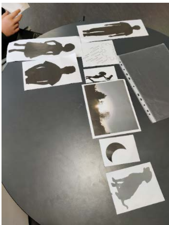
Billede 1: Styr på handlingen – visualisering af personer, tid, sted.

” Fraværet af det visuelle som tekst og billeder samt materialitet, altså fraværet af bogens 'boghed', var en udfordring i forhold til læseoplevelsen og udbyttet.