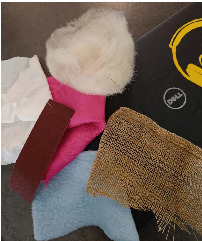
Billede 6: Styr på stemmen – billede af stoffer.

I 8. klasse har vi blandt andet arbejdet med strategien Styr på stemmen , hvor eleverne skal “oversætte” stemmen til en stofprøve (se billede 6).